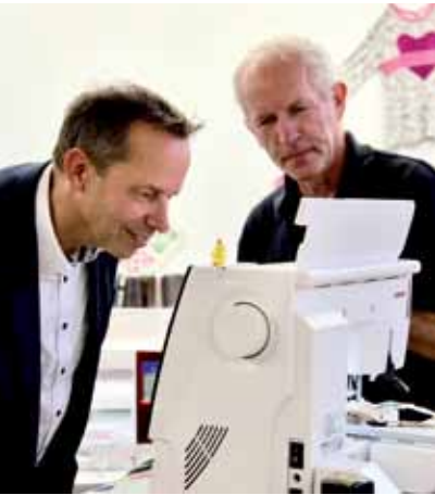
Spannende Einblicke bei Nähmaschinen Lutz.

Kinderlachen, Nähmaschinen, Bauprojekte und Genuss – meine Gemeinde-Tour durch Oggelshausen, Dürnau und Allmannsweiler war voller Highlights! Der Tag begann im Restaurant Löwen in Oggelshausen, gefolgt von einem Besuch des neuen Kindergartenbaus, der die Zukunft der Kleinsten vor Ort sichert. In Dürnau gab es spannende Einblicke bei Nähmaschinen Lutz, bevor es nach Allmannsweiler zum Bauunternehmen Walter ging. Nach einer zünftigen Vesper fand der Tag seinen gemütlichen Ausklang in der Bude „Babalou“.