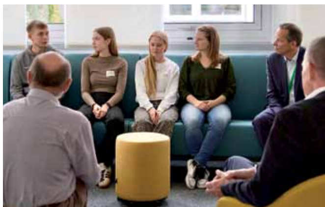
Austausch mit Auszubildenden bei Boehringer-Ingelheim.

Unter www.wahl26.doerflinger-biberach.de finden Sie alles rund um die Landtagswahl.