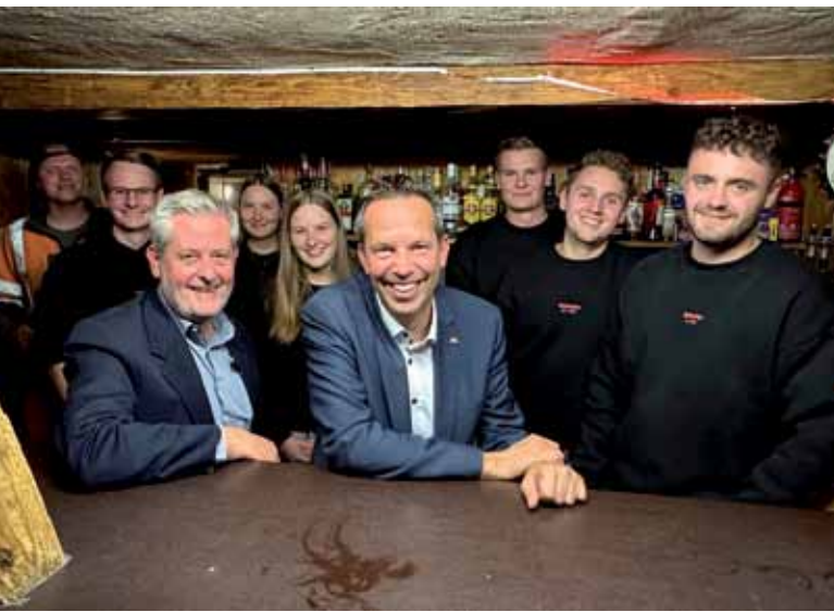
Ausklang in der Bude „Babalou“.